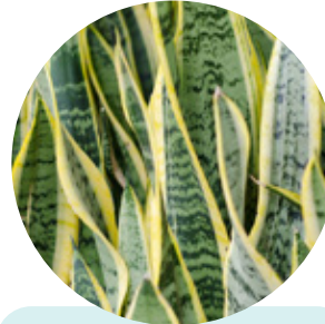
Lengua de suegra