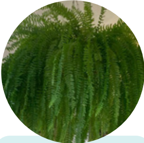
Cola de ardilla